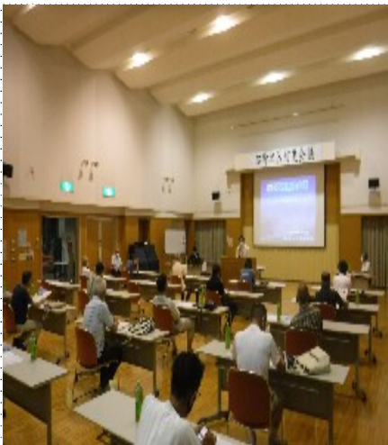
防災危機管理課松野地区担当職員によるスライドを用いた説明

会議は、区長OB会の防災経験者の協力を得て、地区の消防団、水防団、防災リーダーが対象で、新型コロナウイルス感染症拡大防止のために、人数制限して開催しました。市担当職員の挨拶に始まり、先ごろ松野地区に全戸配布された富士川逃げどきマップに基づき、浸水被害状況や活用方法等について説明された。終了後、質問、意見交換に移り、集中豪雨が予想される場合は、富士市の降雨量でなく山梨県南部観測所の測定雨量が避難の判断基準であることや発生が予想される南海トラフ大地震が発生した場合、松野地区の孤立化が予測されることから防災意識を新たにした。