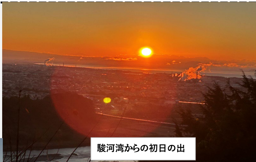
駿河湾からの初日の出