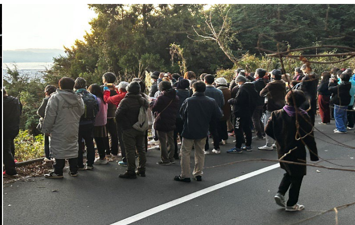
初日の出を拝む元旦 ウォーキングの参加者